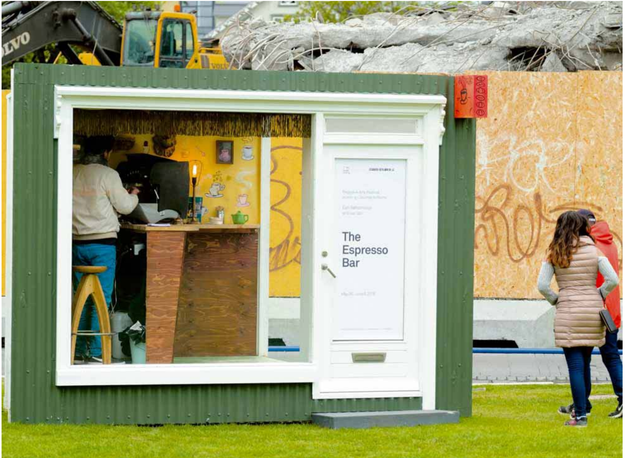
Veisla í farangrinum Hluti af Listahátíð er þessi espressóbar þar sem ljúffengur sopinn er ódýrari en gengur og gerist. Sem stendur er þessi færانlegi kaffistaður á Austurvelli.